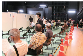
④・⑤問診を終えた人から接種