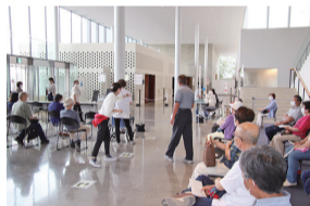
②整理番号順に受け付け