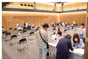
③検温しながら予診票の内容を確認