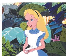
ふしぎの国のアリス

日時 8月28日(土)、午前10時30分～11時45分 会場 美術館・図書館 視聴覚ホール 内容 ふしぎの国のアリス(75分/1953年) 定員 30人(1組4人まで、入退場自由) 申し込み 17日(火)の午後2時から電話で、同館へ ※詳しくは同館HPをご覧ください。