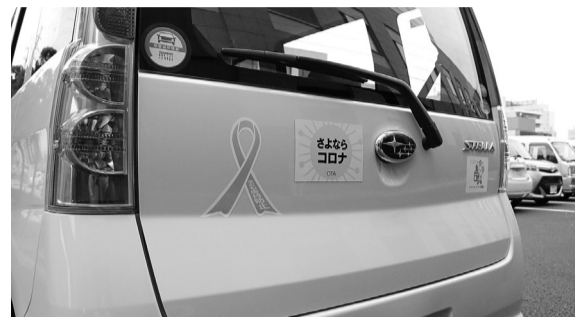
公用車などにも貼っています