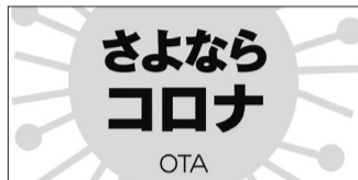
マグネットシート(縦12cm×横18cm)