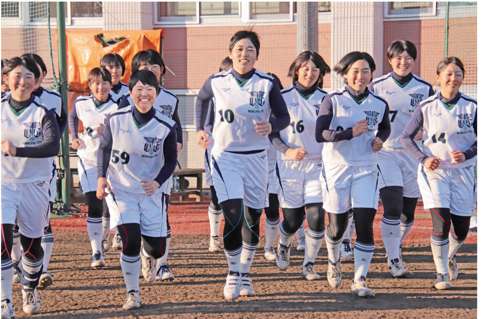
市立太田高等学校 女子ソフトボール部の皆さん