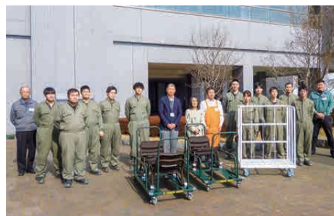
県立太田産業技術専門校の皆さん