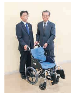
太田中央ロータリー クラブより