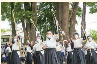
#生品神社鉤矢祭(5月8日) 3年振りの集結。「五月の空」にかぶらや鉤矢が放たれました!