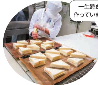
スワンベーカリー