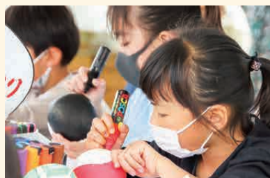
#おた街なかジャズフェスタ× OTA CITY MARKET(5月15日) オリジナルだるま作りにチャレンジ!