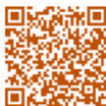
大田市中文 新冠疫苗信息