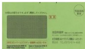
第四次接种通知 绿色信封