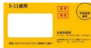
小儿接种橙色信封