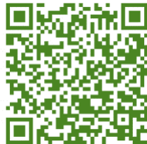
太田市中文新冠疫苗信息