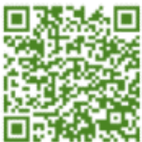
群馬电子申请系统