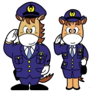
Mascotes Joshu-kun e Miyama-chan