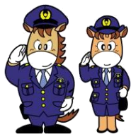
Mascotes Joshu-kun e Miyama-chan