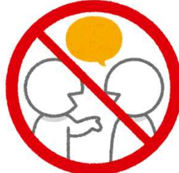
Evite falar alto