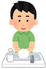
Lavar as Mãos