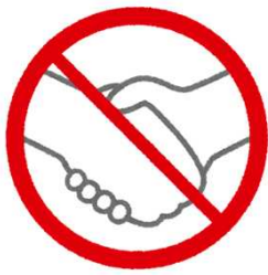
Evite aperto de mão,