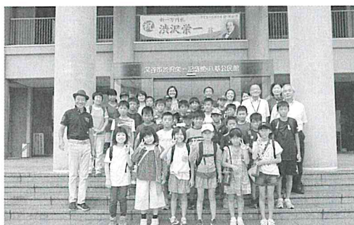
渋沢栄一記念館 (埼玉県深谷市)