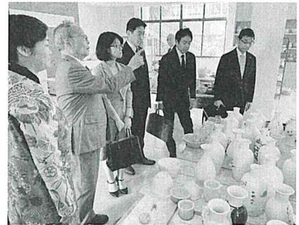
嘉定区中光高等学校視察

また、滞在中には嘉定区藤公園や自動車博物館、人工知能運転開発研究所などを視察しました。