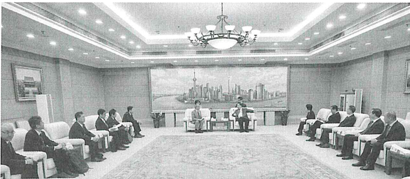
嘉定区政府と会談