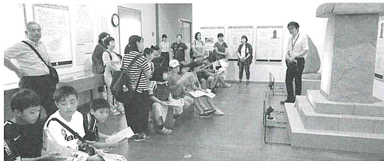
多胡碑記念館 (高崎市)