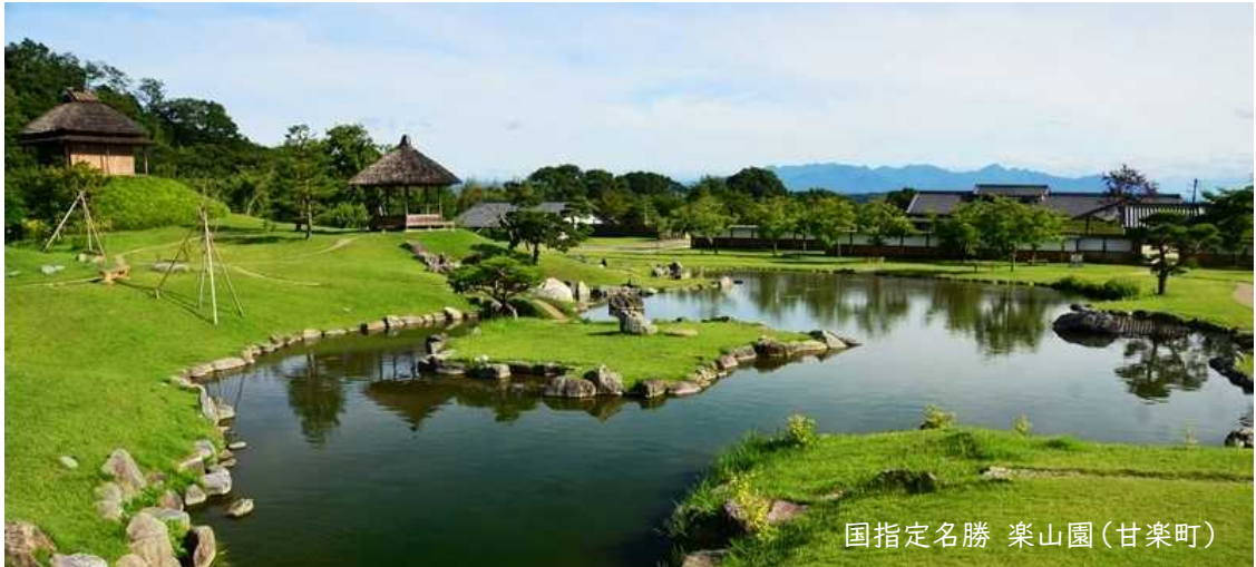
国指定名勝 楽山園(甘楽町)

掲載行事は、新型コロナウイルス感染症拡大防止のため、延期や中止となる場合があります。