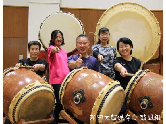
新田太鼓保存会 鼓風組