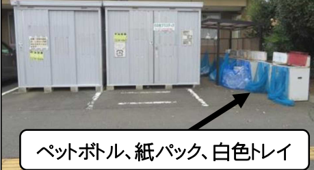
ペットボトル、紙パック、白色トレイ