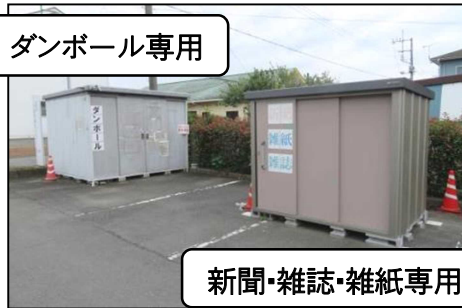
新聞・雑誌・雑紙専用