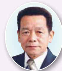
副議長 岩崎喜久雄