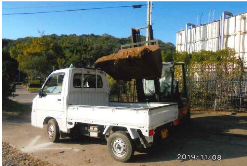
土砂をフォークで積み込み