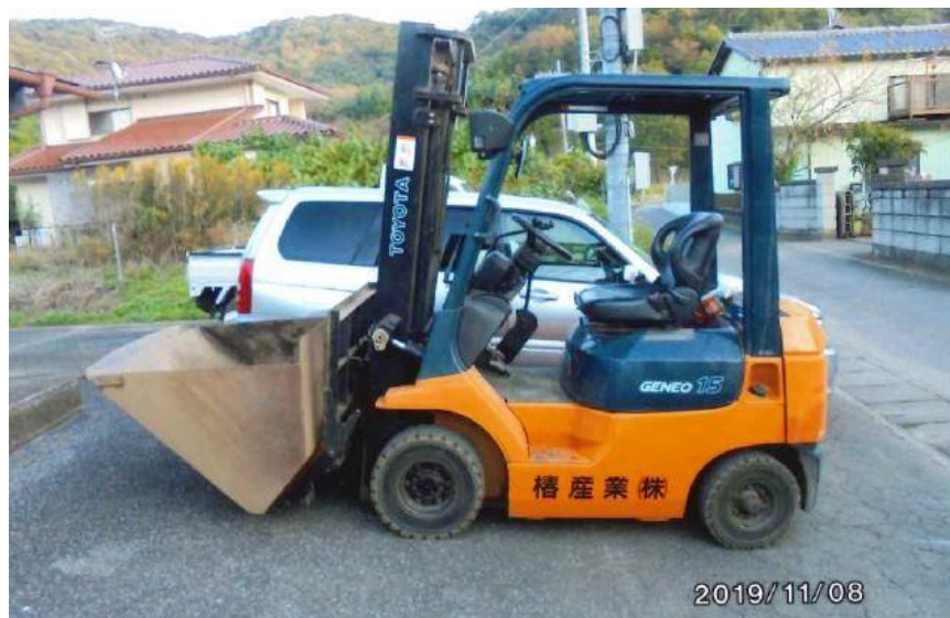
活躍した「フォークリフト」