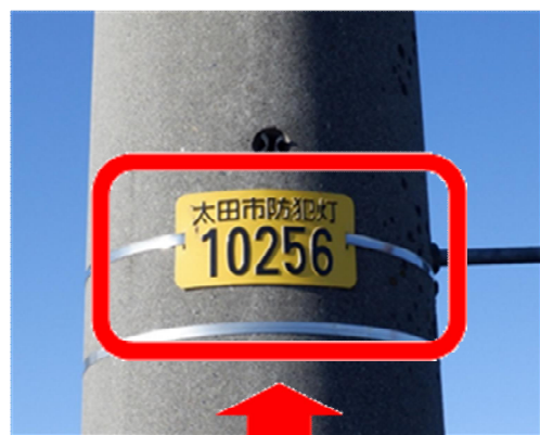
防犯灯管理プレート

犯罪の未然防止は、警察、行政は無論のこと地域住民全体が一体となって取り組むことが大切です。防犯委員の活動にご理解・ご協力をお願いします。