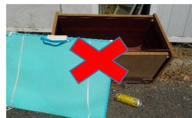
↑リサイクル倉庫に搬出された対象外の廃棄物

最近、リサイクル倉庫に対象外の廃棄物の搬出が増えて困っています。分別できないものは、直接搬入などのご協力をお願いします。