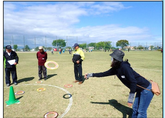
※自宅での検温・マスクの着用をお願いします。