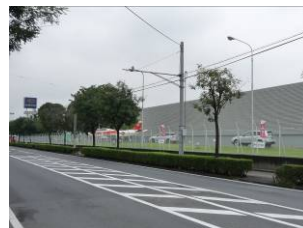
道路からの眺めに配慮