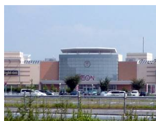
ショッピングセンター