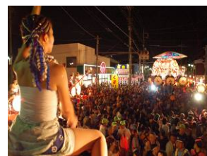
尾島ねぷたまつり