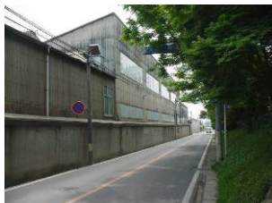
コンクリート塀の工場