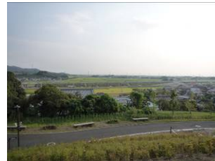
北部運動公園からの眺め