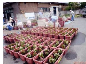
通学路の清掃・美化活動 (大原5地区)