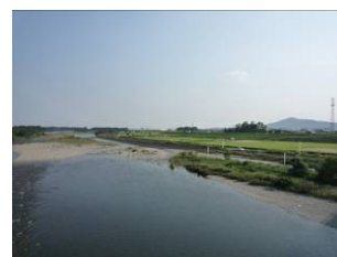
渡良瀬川からの眺め