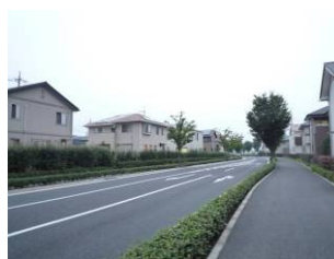
Pal town 城西の杜