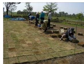
石田川緑地再生事業