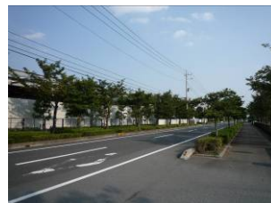
街路樹等の緑が多い工場