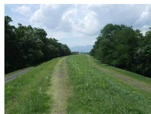
渡良瀬川河川緑地