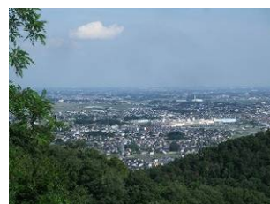
金山山頂からの眺め