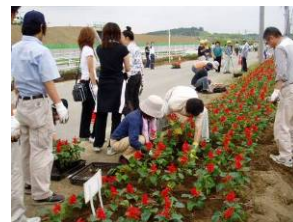
強戸地区花いっぱい運動